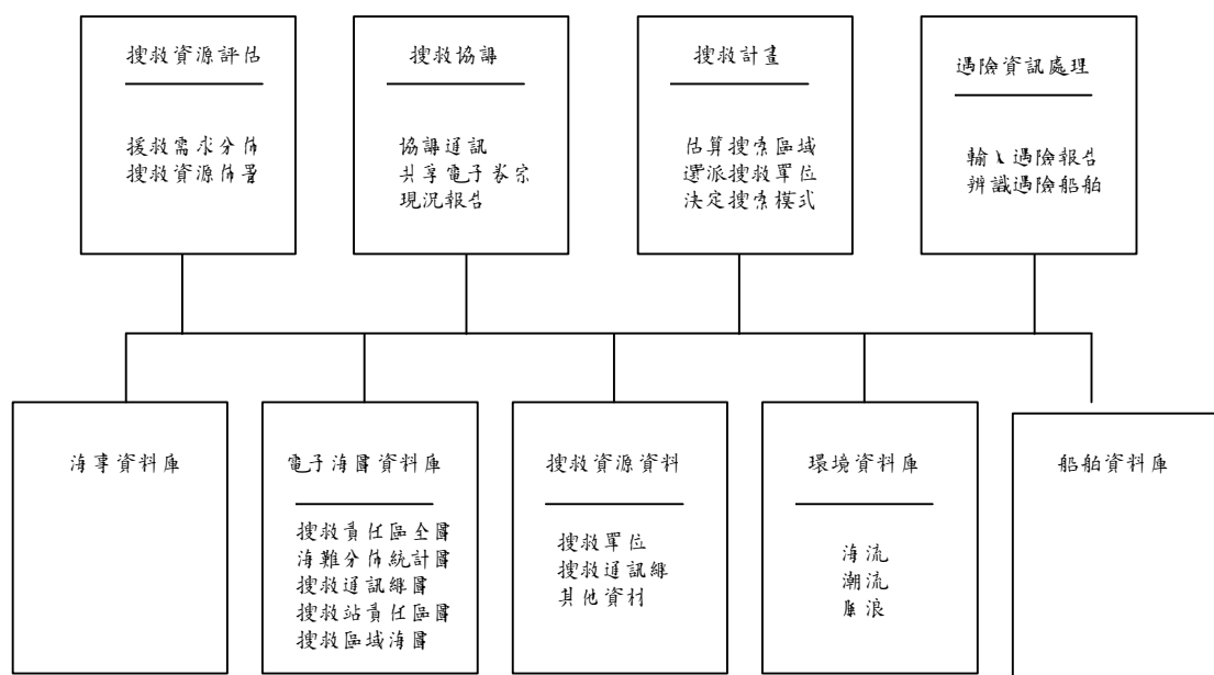
圖一、搜救系統架構